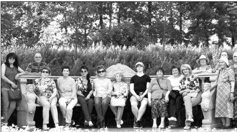
Силламяэцы в усадьбе Марьино Ленинградской области.

- Разделяю мнение тех, кто говорит, что самое хорошее образование – это путешествия, поскольку расширяют наш кругозор, заставляют по-иному посмотреть на мир, постичь какие-то его тайны, увидеть своими глазами и оценить увиденное. Детей надо, конечно, приучать к этому. Если ребёнок с детства не бывал ни в одном театре, ни в одном музее, видел мир только из окна собственной квартиры, то вряд ли в последующие годы ему вдруг захочется пойти на спектакль или поехать на экскурсию. Я наблюдаю