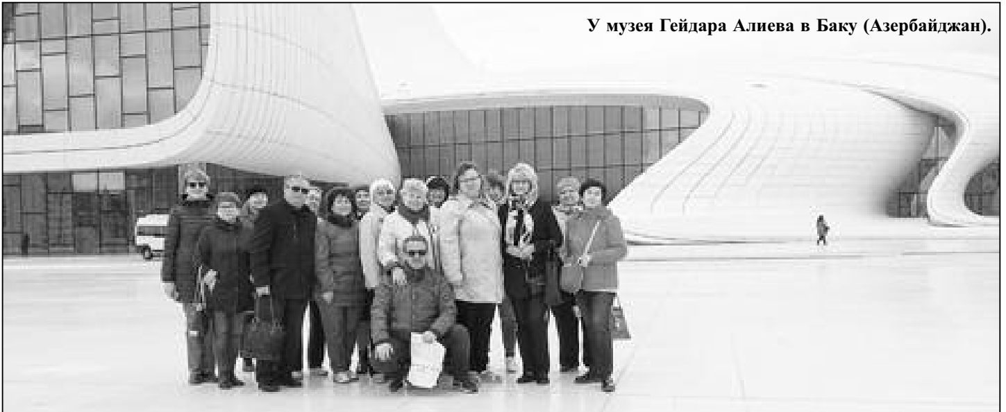
У музея Гейдара Алиева в Баку (Азербайджан).

тенденцию, что сейчас взрослые стали меньше и меньше брать в поездки детей – жаль. А я старалась при любой возможности обязательно вывезти своих троих детей и в театры, и на концерты, и на экскурсии, а теперь хочется и у внуков воспитывать интерес к ним.