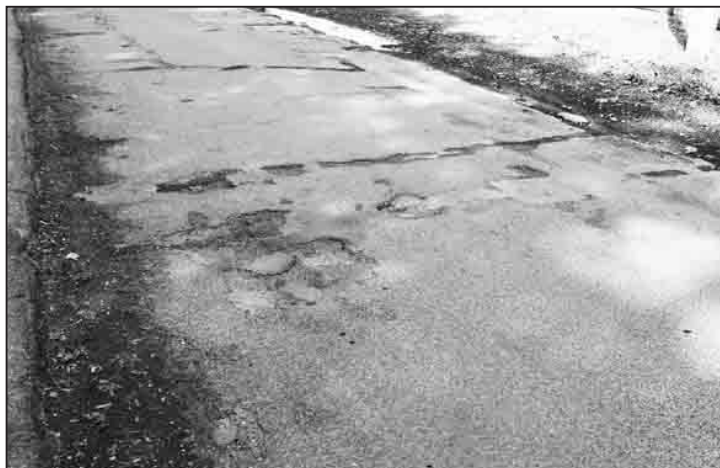
Николай КЛОЧКОВ, фото автора