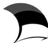
Eesti tuleviku heaks