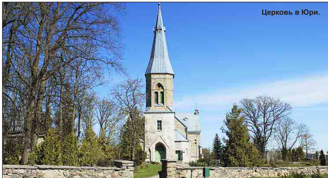
Церковь в Юри.