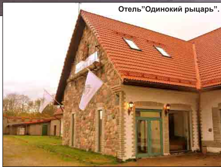
Отель “Одинокий рыцарь”.