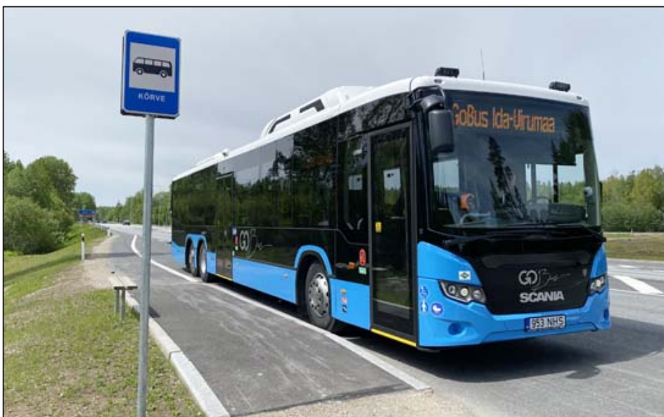
Так выглядят новые уездные автобусы.

Автобусы, которые выйдут на уездные линии с июля, внешне похожи на те, что уже курсируют по Нарве и Силламяэ. Там, где уездные и городские маршруты обслуживаются одной фирмой, при необходимости машины можно будет в рамках одного парка и взаимозаменять.