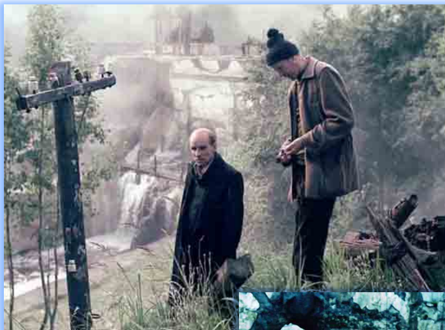
Кадры из «Сталкера».

Если в начале Сталкер, как писал сам Тарковский, был «разновидностью торговца наркотиками или браконьером», зарабатывающим на том, что во-