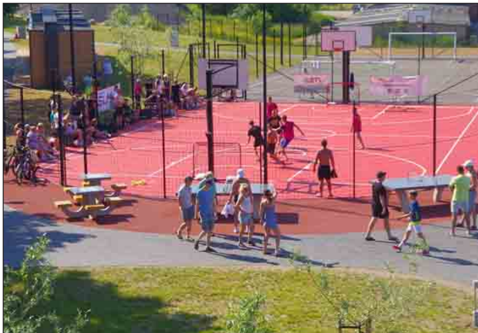
«Игра в клетке».